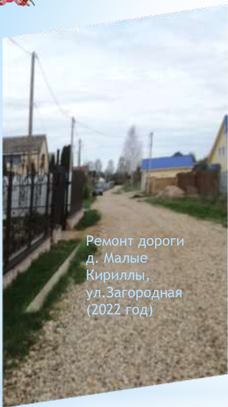
Ремонт дороги д. Малые Кириллы, ул.Загородная (2022 год)

Администрация Кирилловского сельского поселения Рославльского района Смоленской области участвует в реализации Государственной программы «Развитие дорожно-транспортного комплекса Смоленской области» на проектирование, строительство, реконструкцию, капитальный ремонт и ремонт автомобильных дорог общего пользования местного значения