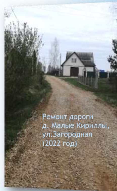
Ремонт дороги д. Малые Кириллы, ул.Загородная (2022 год)

Администрация Кирилловского сельского поселения Рославльского района Смоленской области участвует в реализации Государственной программы «Развитие дорожно-транспортного комплекса Смоленской области» на проектирование, строительство, реконструкцию, капитальный ремонт и ремонт автомобильных дорог общего пользования местного значения